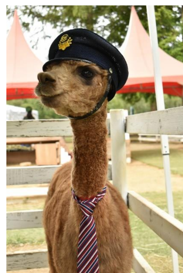
一日駅長のミッティーちゃん