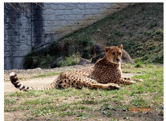
チーター「バステト」