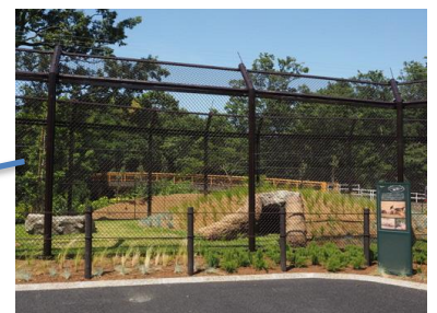
ブチハイエナ展示場