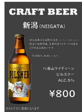
販売予定のクラフトビール銘柄(一部)