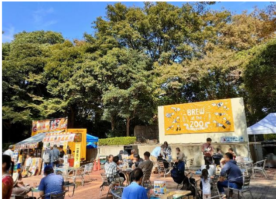
昨年の開催の様子

App Store または Google Play にてアプリをダウンロード ※登録無料