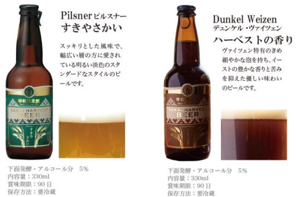
販売予定のクラフトビール銘柄（一部）