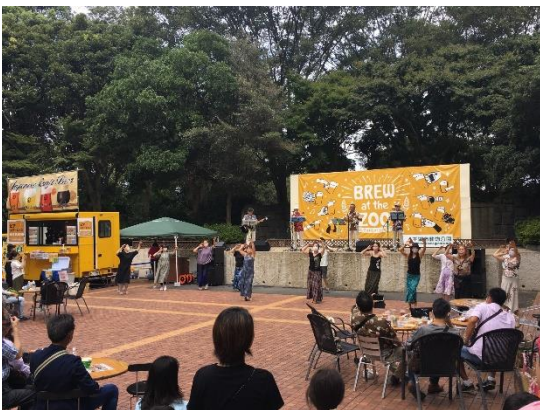
ー昨年の開催の様子